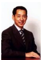
開会式挨拶 日本科学未来館館長 毛利 衛 先生